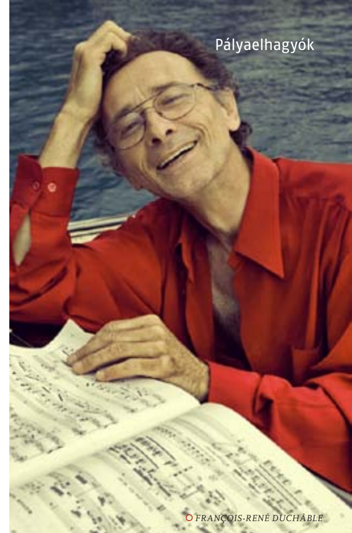
○ FRANÇOIS-RENÉ DUCHÂBLE

Ritkaság lenne az efféle hirtelen elhatározás? Ha rosszmájúak vagyunk, azt mondhatjuk: jóval ritkább, mint szükséges volna. Gyakoribb az az eset, amikor a közönség kedvencét le sem lehet kergetni a színpadról. Az operairódalom néhány szerepe pályájuk csúcán már túljutott, ám még mindig művészi erejük teljében lévő énekesek részére van fenntartva: A pikk dáma