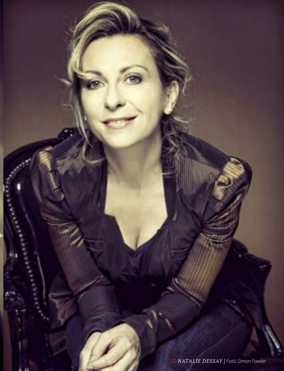
○ NATALIE DESSAY

teljesíthetetlennek bizonyultak. Kivéve két esetet: az egyik, amikor elvállalta Médeia szerepét Pier Paolo Pasolini filmjében – a Cherubini operájában oly sokszor megformált karaktert most prózai színésznőként keltette életre a filmvásznon, lebilincselően. Sor került emellett egy Giuseppe Di Stefanóval közös koncertsorozatra is: a két legenda a felvételek tanúsága szerint hangjának romjaival énekelt, a közönség mégis elragadtatottan