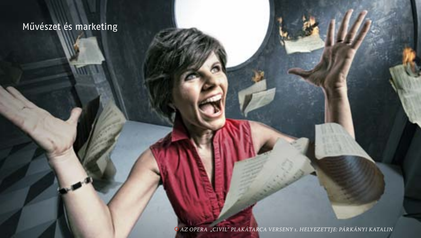
© AZ OPERA „CIVIL” PLAKÁTARCA VERSENY 1. HELYEZETTJE: PÁRKÁNYI KATALIN