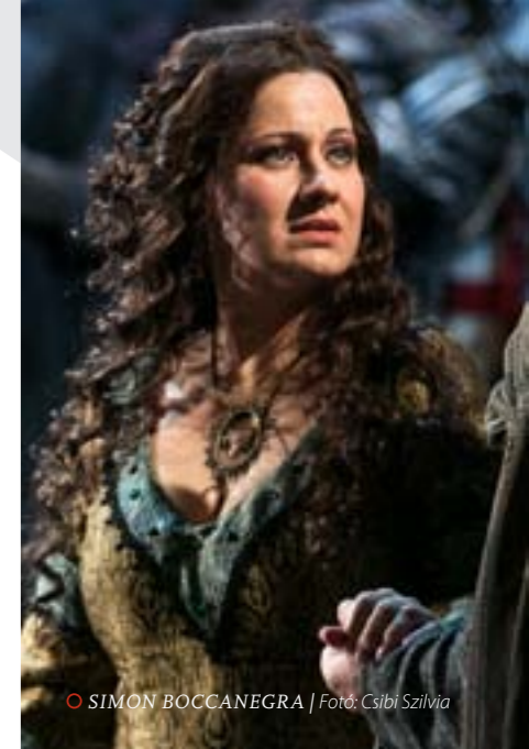
© SIMON BOCCANEGRA | Foto: Csibi Szilvia

Nyilván az sem véletlen, hogy Verdi operái megtalálták. A legutóbbi évadban mindhárom új szerepe Verdihez kötődik, három hónap alatt három premier: Rómában A két Foscariban , a Melbourne-i Operában Az álarcosbálban , a Magyar Állami Operaházban a Simon Boccanegrán énekel. Különös süllyal esett a latba a pesti operai megmérettetés. „Engem itthon