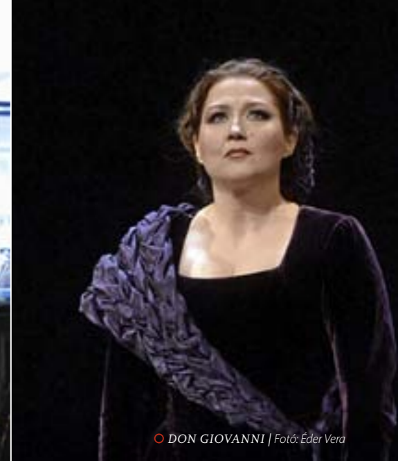
○ DON GIOVANNI

„Jövőre huszonhét előadásom van itthon, és ez a nők között extrém soknak számít” – mondja, és hozzáté-szi, húsz-harminc évvel ezelőtt sokkal több lehetőség volt a szerepkörében, szélesebb volt a repertoár, egy-egy énekesre ötven körüli előadás jutott a főszerepekből. De ezt csupán tényként említi, egyáltalán nem panaszodik, és nem érzi, hogy a műfajt temetni kelle-ne. „Az elmúlt időszak tapasztalatainak köszönhetően egyre inkább az a meggyőződésem, hogy az érdeklődés nem csökken, inkább úgy fogalmaznék, a hozzáférés lehetőségei szűkültek. Ez egy nagyon drága műfaj, ami a jegyárban is megmutatkozik, de azzal, hogy az Erkel Színház visszakerül a pa-lettára, már most érezhető a növeke-dés. Nem hiszek abban, hogy az opera kevesebb embert érdekel, mert mindig felnő egy korosztály, akiknek ez a műfaj fontos lesz.”