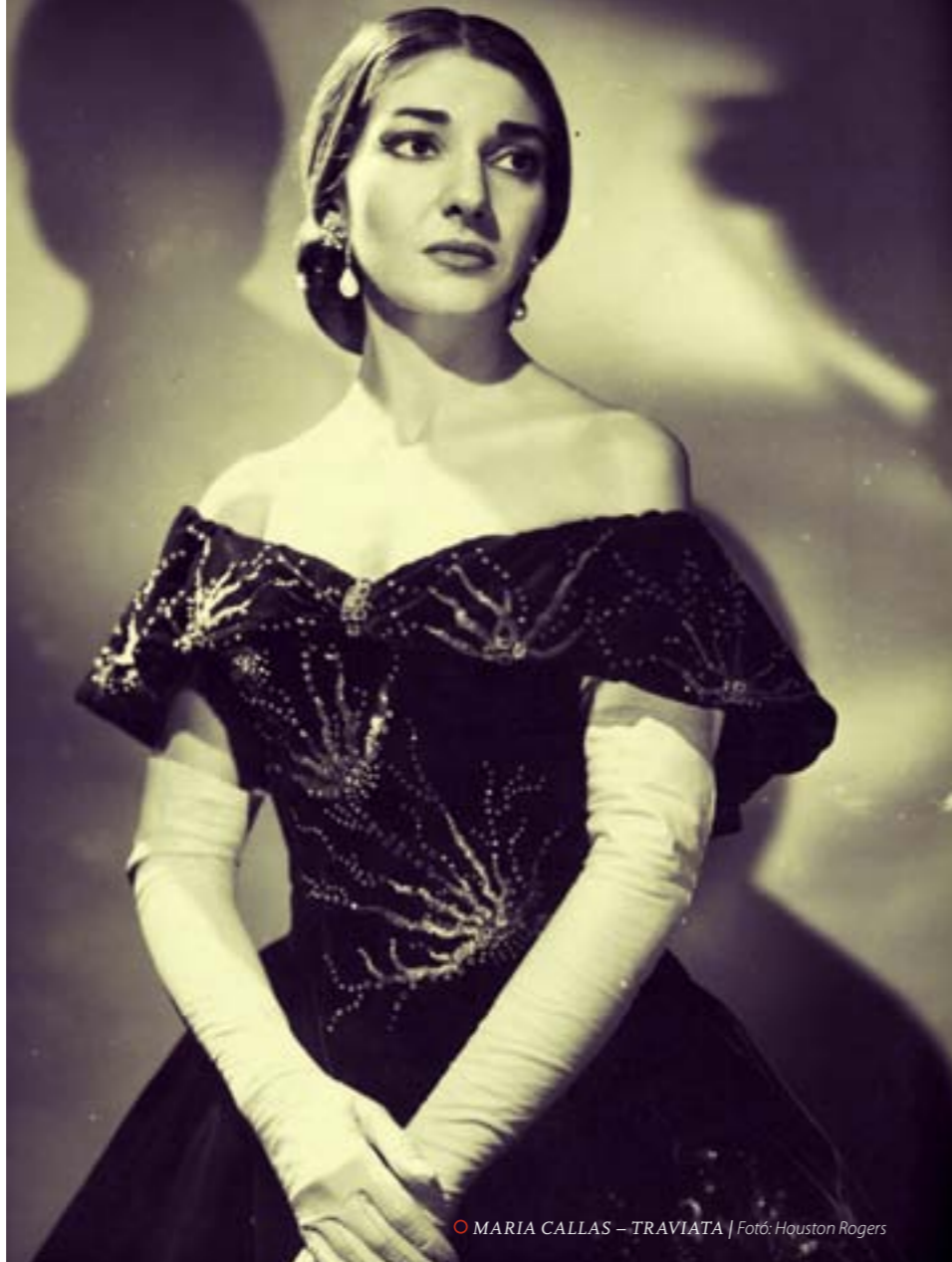
○ MARIA CALLAS – TRAVIATA

Könnyebben magyarázható a 20. század talán legnagyobb hatású primadonnája, Maria Callas hirtelen visszavonulása: az ő esetében a magánéleti válságok sorozata, a hangját